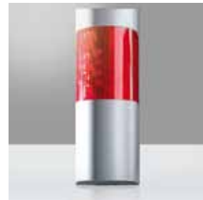
Der optisch-akustische Signalgeber von TELENOT verfügt über die höchste Sicherheitsklasse VdS Klasse C.

Alle Alarmanlagenkomponenten, die in der Arztpraxis verbaut wurden, erfüllen besondere Qualitätsansprüche. Permanente Funktionalität und absolute Zuverlässigkeit (24 Stunden am Tag, sieben Tage in der Woche) – und das über Jahre hinweg – sind dabei elementar. TELENOT-Produkte verfügen über Sabotagesicherungen, Abreißkontakte, Übersprühchutz und eine Notstromversorgung. Modernste Produktionsverfahren in Verbindung mit einer enormen Fertigungstiefe am Standort Deutschland garantieren Produkte auf höchstem Qualitätsniveau.