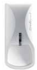
Das Gehäuse des Bewegungsmelders comstar stammt von Designer Luigi Colani.

Zur Einbruchmeldeanlage lässt sich zudem ein Überfallmelder installieren. Kommt es zu einer Bedrohung, können Mitarbeiter per Knopfdruck einen „stillen“ Alarm an hilfeleistende Stellen senden.